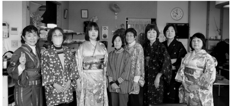
3度目の成人式?! 着納めができました。中には4度目の人も?

家で眠っている着物が色々な形でよみがえるのは、支部で預かっている私達もとても嬉しくなります。又、3回4回と続けていける様に頑張ります。