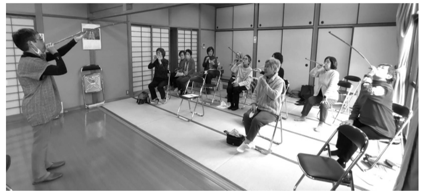
ロングピロピロを頑張って吹いている様子

ロングピロピロは、見た目以上にきつく、特に最初の一吹きが伸びてくれず難しかったです。ゆっくり伸ばすのも巻き込むのも結構きつい想像以上に、腹式呼吸をすることで腹筋を使うことが分かりました。みんな必死でやりながら、もどす時に大きな音がすると笑いが起き、楽しい時間でした。ロングピロピロは、いつも食卓に置き、食事前などいつでも出来るようにしたいと思いました。