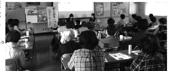
グリーンコープさんの話を聞いている様子

グリーンコープさんの四つの共生理念〈自然と人・女と男・南と北・人と人〉を私達も自らに問いかけながら医療生協活動をしていきたいと思いました。(西支部運営委員一同)